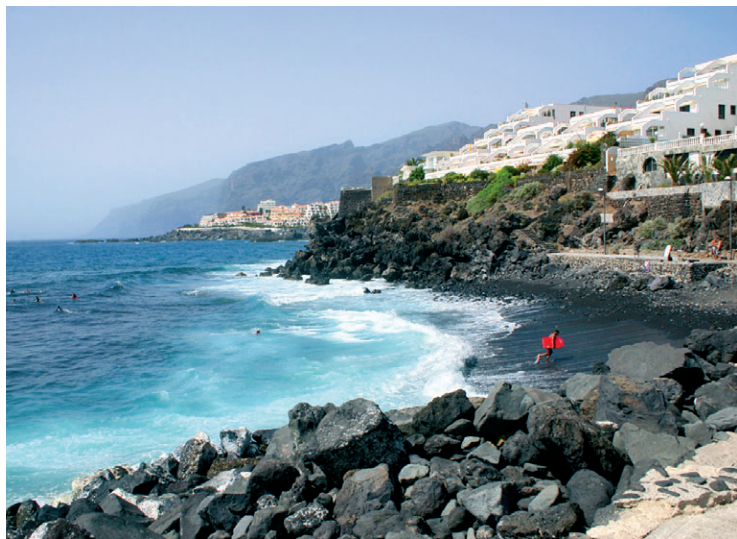
Zachodnie wybrzeże Teneryfy

Z kolei południe wyspy przywita nas słońcem, zapraszając do tętniących życiem kurortów: Los Cristianos, Playa de las Américas (Costa Adeje). To tutaj znajduje się największa baza noclegowa Teneryfy. Południowe kurorty z racji dobrej pogody są zatłoczone przez